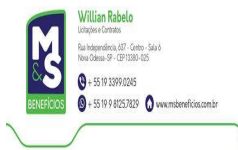
image001.jpg 14 KB