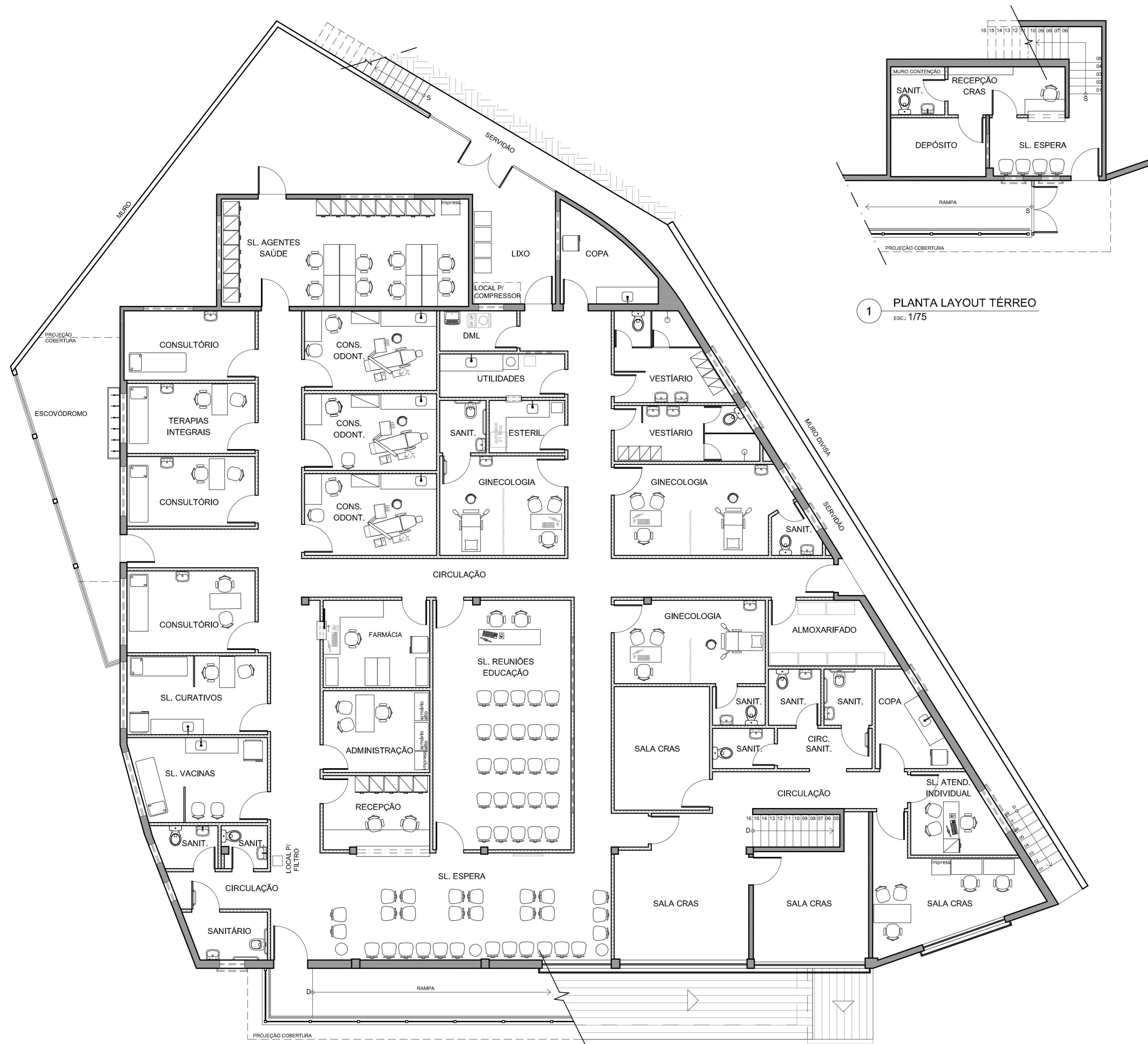
1 PLANTA LAYOUT TÉRREO esc.: 1/75