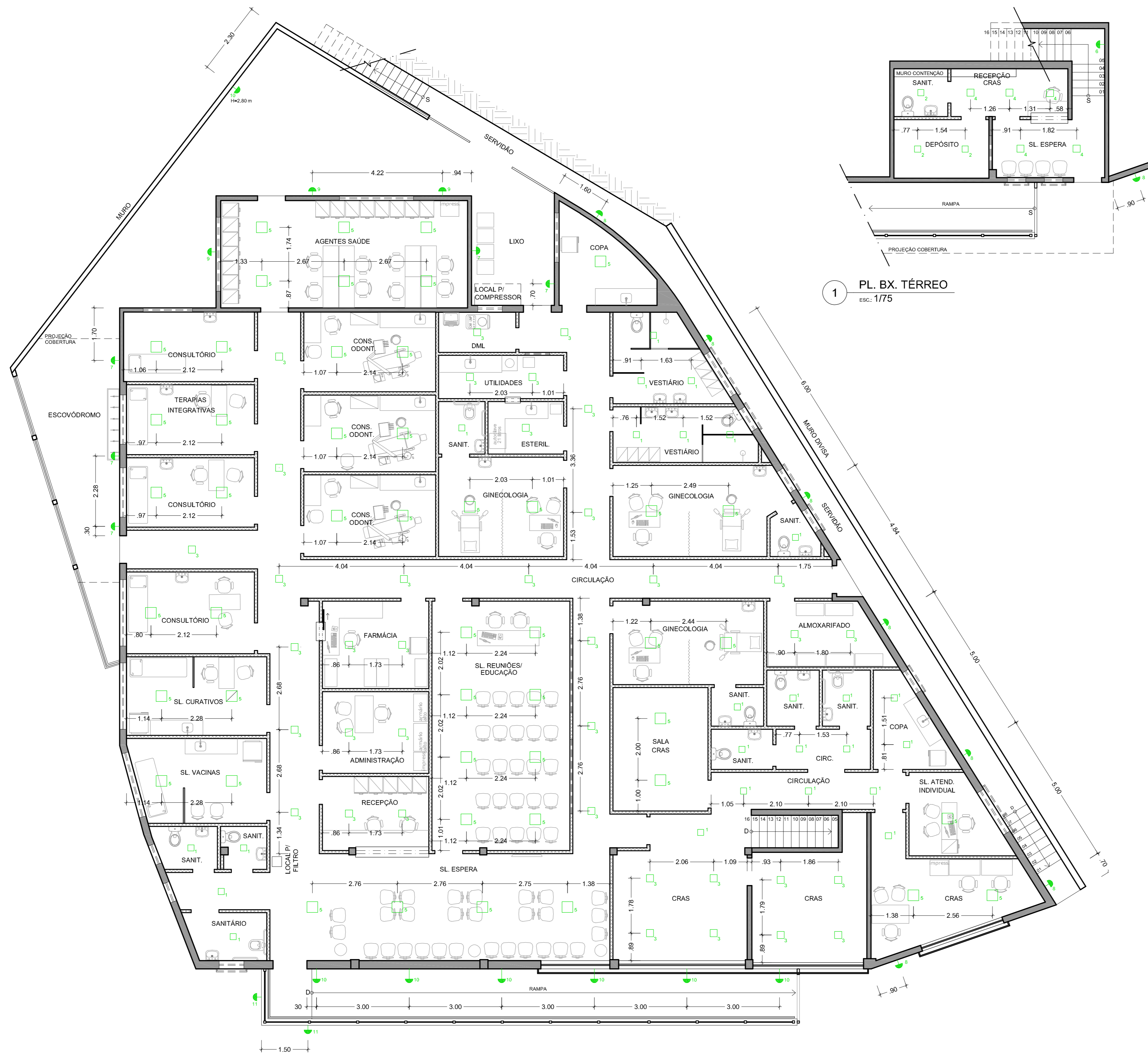
1 PL. BX. TÉRREO ESC.: 1/75

- pontos não cotados estão centralizados