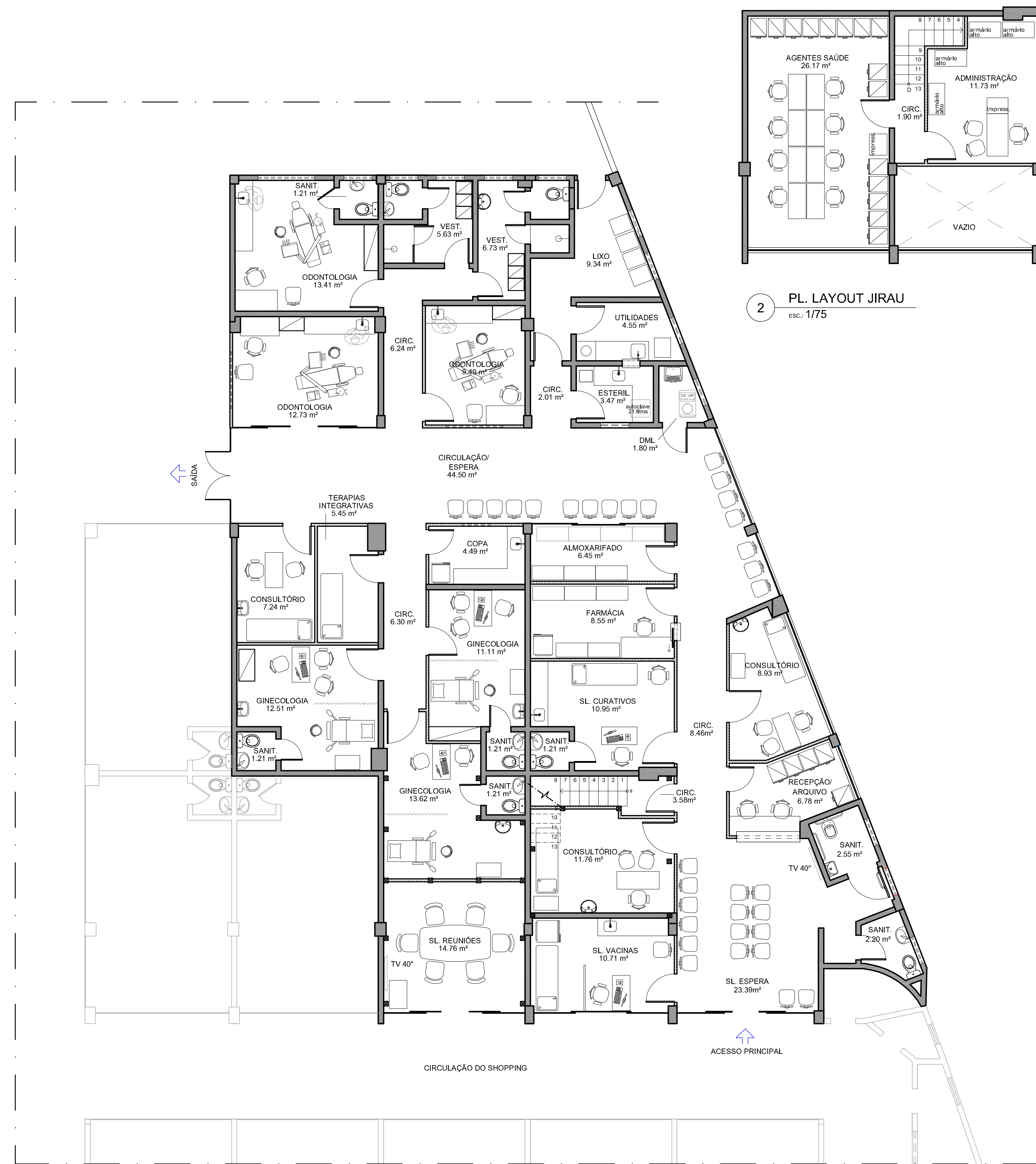
1 PL. LAYOUT PISO TÉRREO esc: 1/75