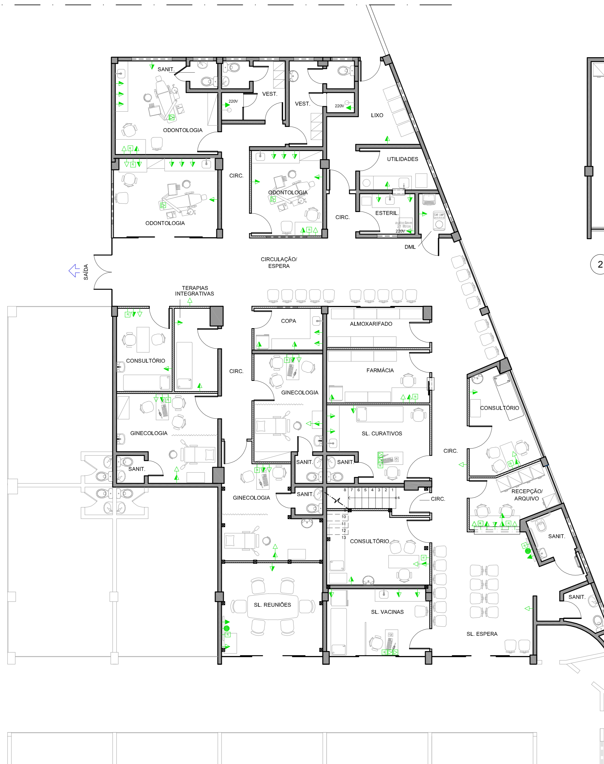
1 PL. BX. 1º PISO Esc.: