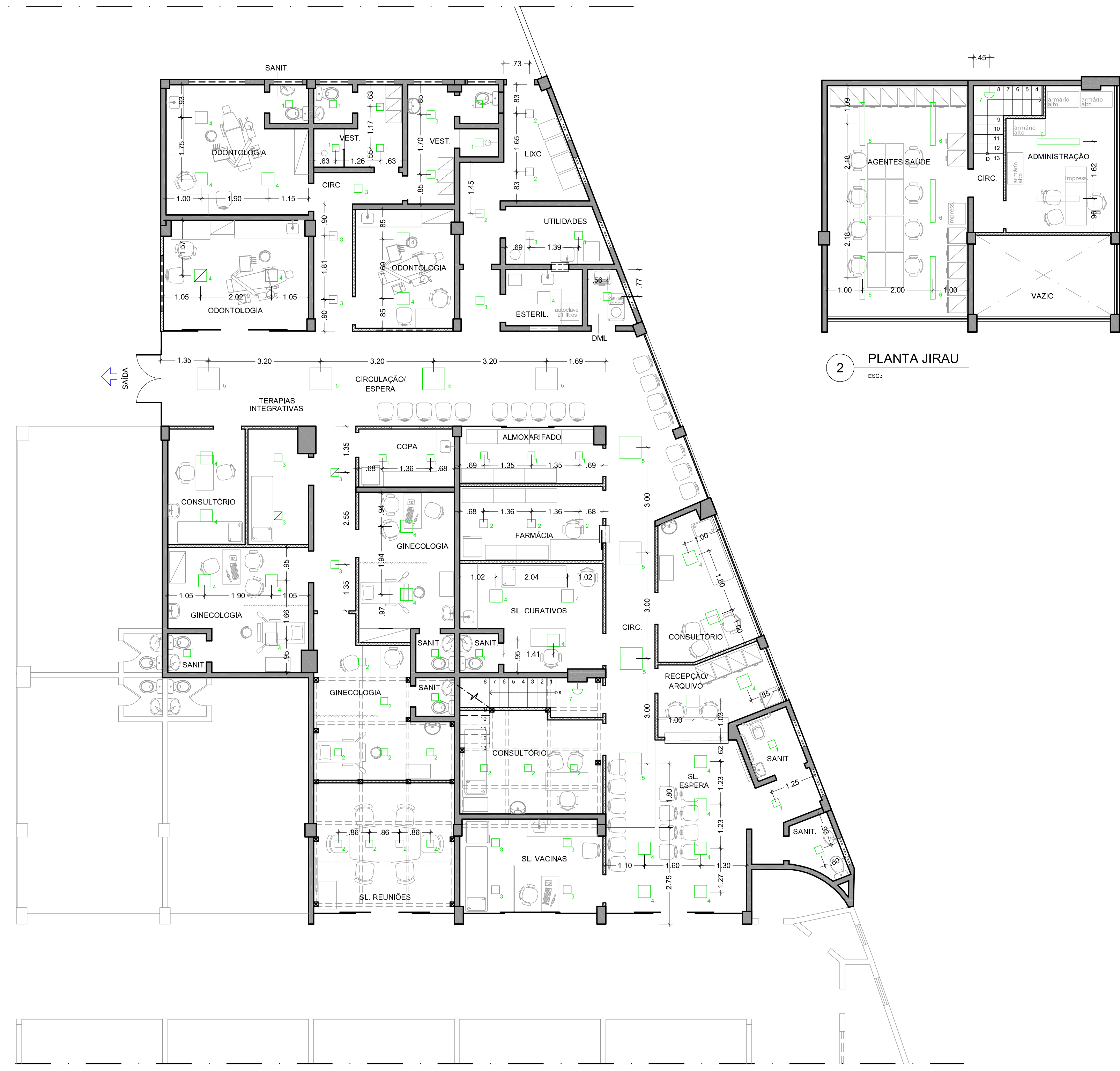
1 PLANTA 1º PISO Esc.:

Observação: - pontos não cotados estão centralizados