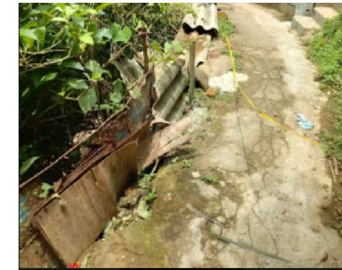
Local da intervenção