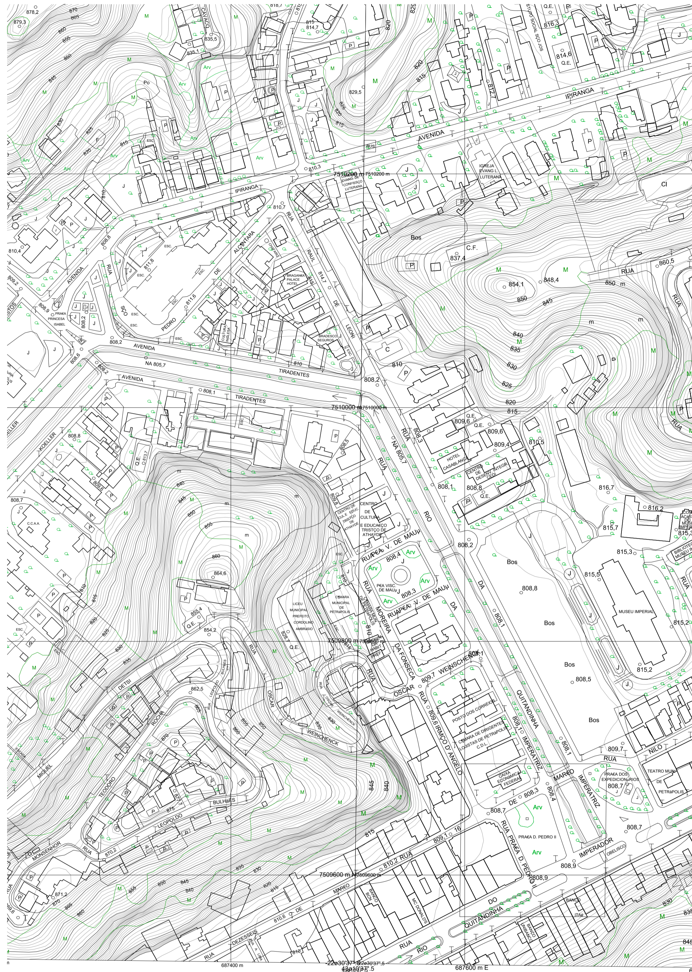
1 PLANTA DE LOCALIZAÇÃO ESCALA 1/2000