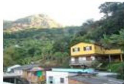
Foto 004 - Moradia construída no talvegue.