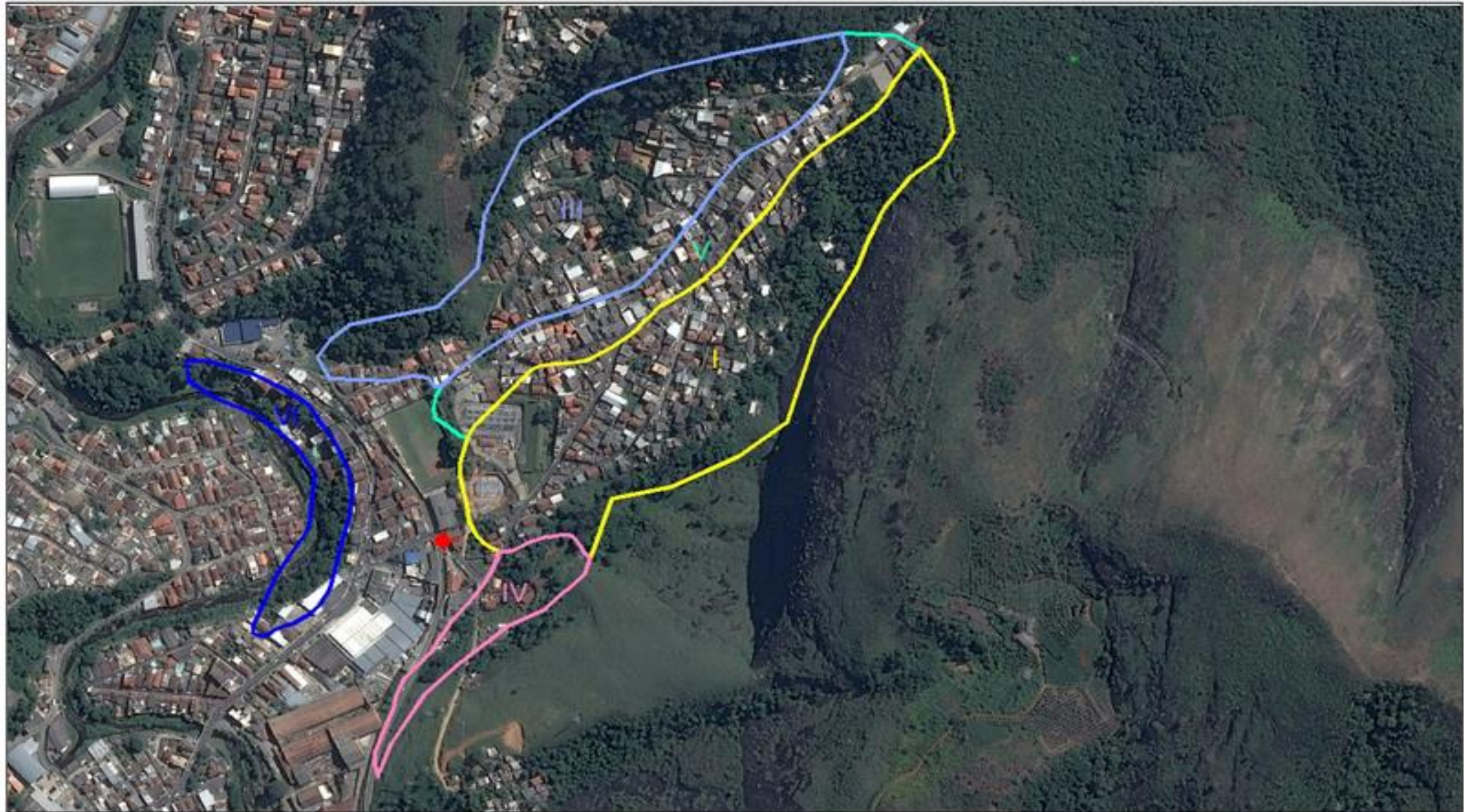
FOTO DE SATÉLITE 01