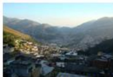
Foto 002 - Ocupação consolidada na encosta.