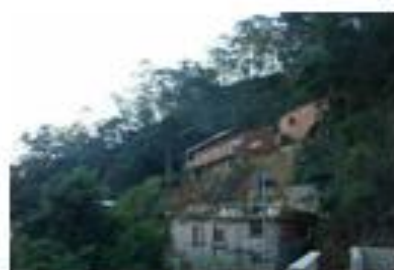
Foto 001 - Deficiência de drenagem e corte inadequado.