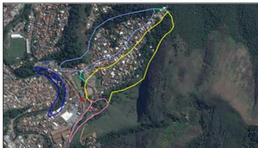
FOTO DE SATÉLITE 01