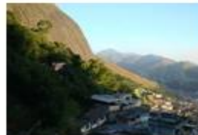
Foto 003 - Construções muito próximas ao maciço rochoso.