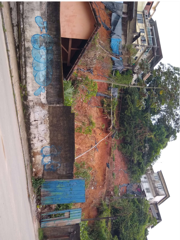
FOTO DO LOCAL