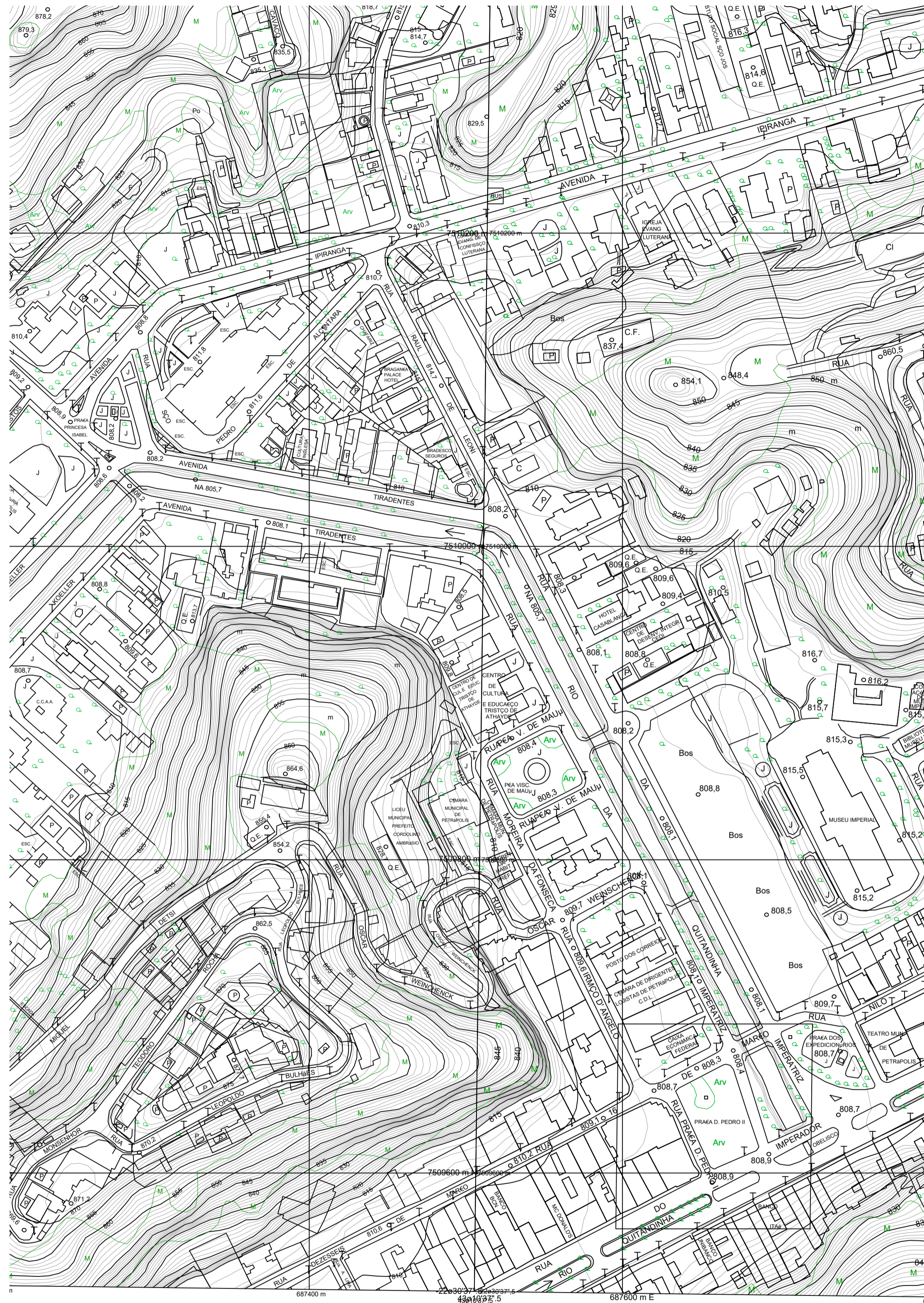
1 PLANTA DE LOCALIZAÇÃO ESCALA 1/2000