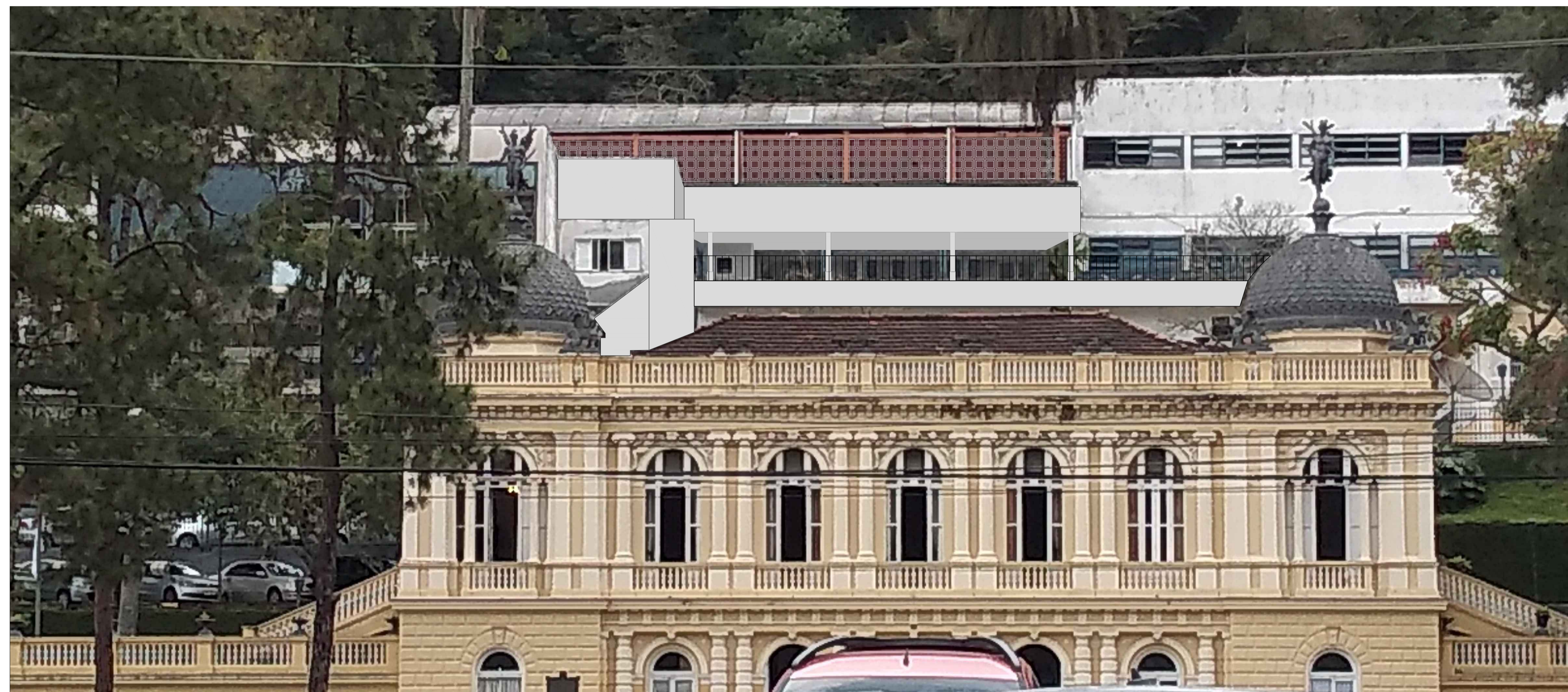
2 LICEU MUNICIPAL - PROPOSTA DE INTERVENÇÃO CONTEXTUALIZAÇÃO DA FACHADA COM A CÂMARA MUNICIPAL ESCALA 1/100