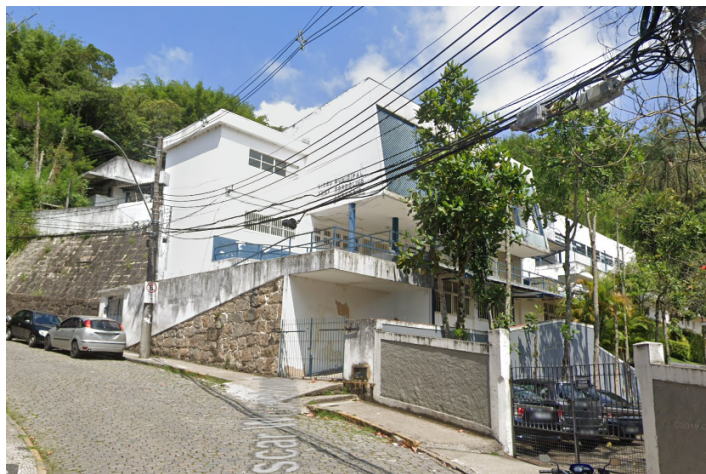
Imagem 1: Vista do imóvel em questão na Rua Oscar Weinschenk. Fonte: Google Street View , em janeiro de 2019.