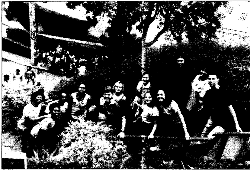
O Museu Casa de Santos Dumont recebeu a visita de 9.569 estudantes no mês de outubro. O número é 79,9% superior ao registrado em setembro.

Em toda a rede estadual de ensino, são 700 mil crianças e adolescentes, em 1.222 escolas. Em outubro, o governo estadual liberou verba para o aluguel de três ônibus de turismo por unidade - por mês até dezembro - para que elas realizassem visitas a museus, monumentos históricos, atrativos turísticos, entre outros destinos à escolha das direções dos colégios. "E, a partir desse pro-