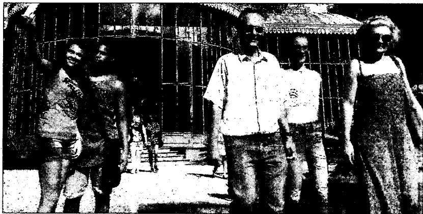
A criação de um amplo calendário de eventos tem o objetivo de estimular a permanência dos turistas na cidade por um período maior.

internacionais com um forte calendário de eventos que une belezas naturais, cultura, história, lazer e sabores. Um desses itens é o Petrópolis Gourmet que apresenta a alta gastronomia em um festival que um prepo-