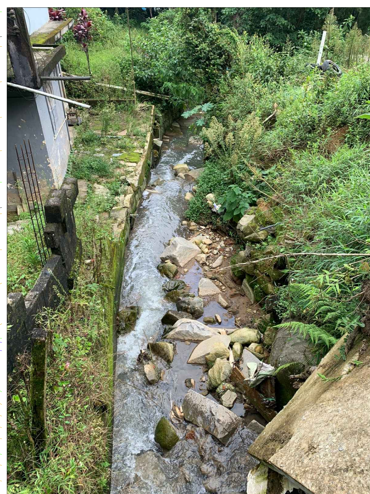
7 TRECHO 04 - LIMPEZA CANAL + MURO EM CONCRETO ARMADO NA MARGEM ESQUERDA + MURO EM GABIÕES NA MARGEM DIREITA