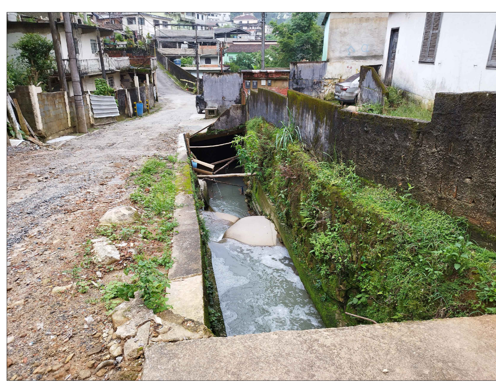
4 TRECHO 02 - REFAZIMENTO DE MURO EM CONCRETO ARMADO