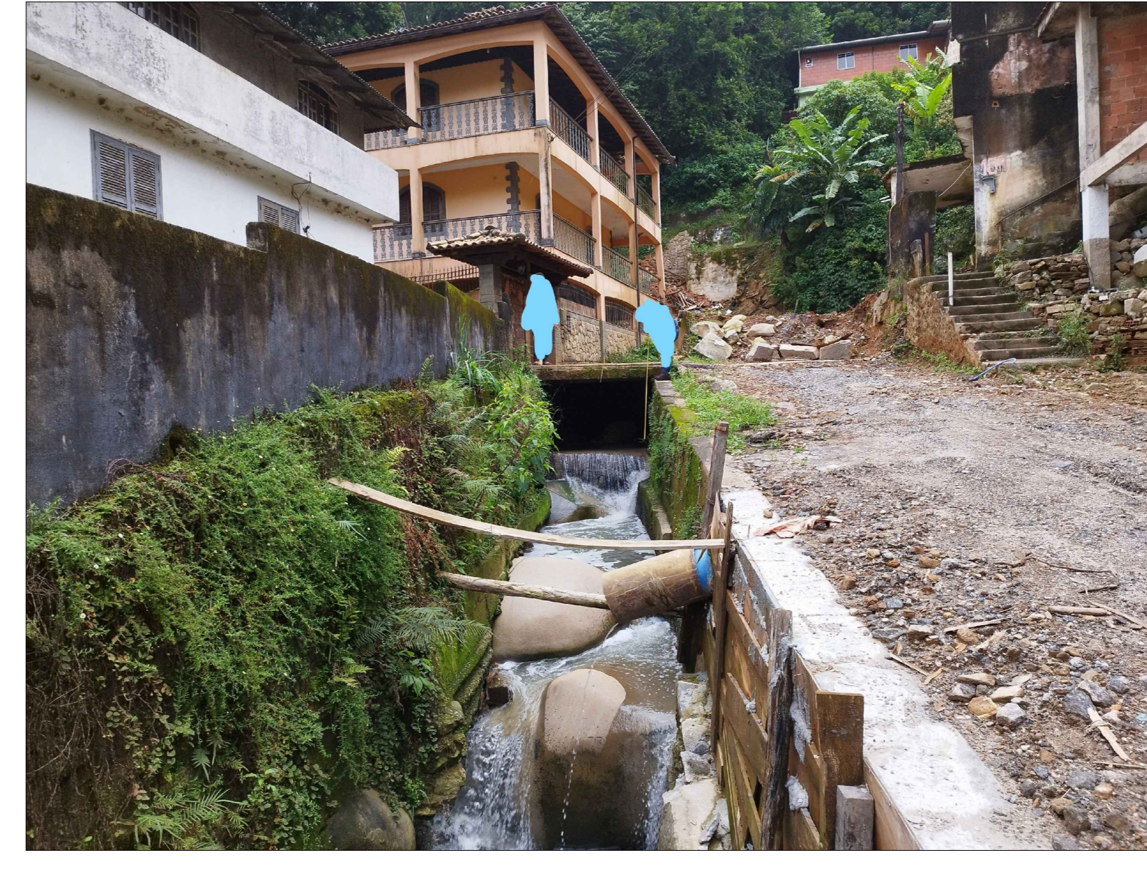
5 TRECHO 02 - REFAZIMENTO DE MURO EM CONCRETO ARMADO