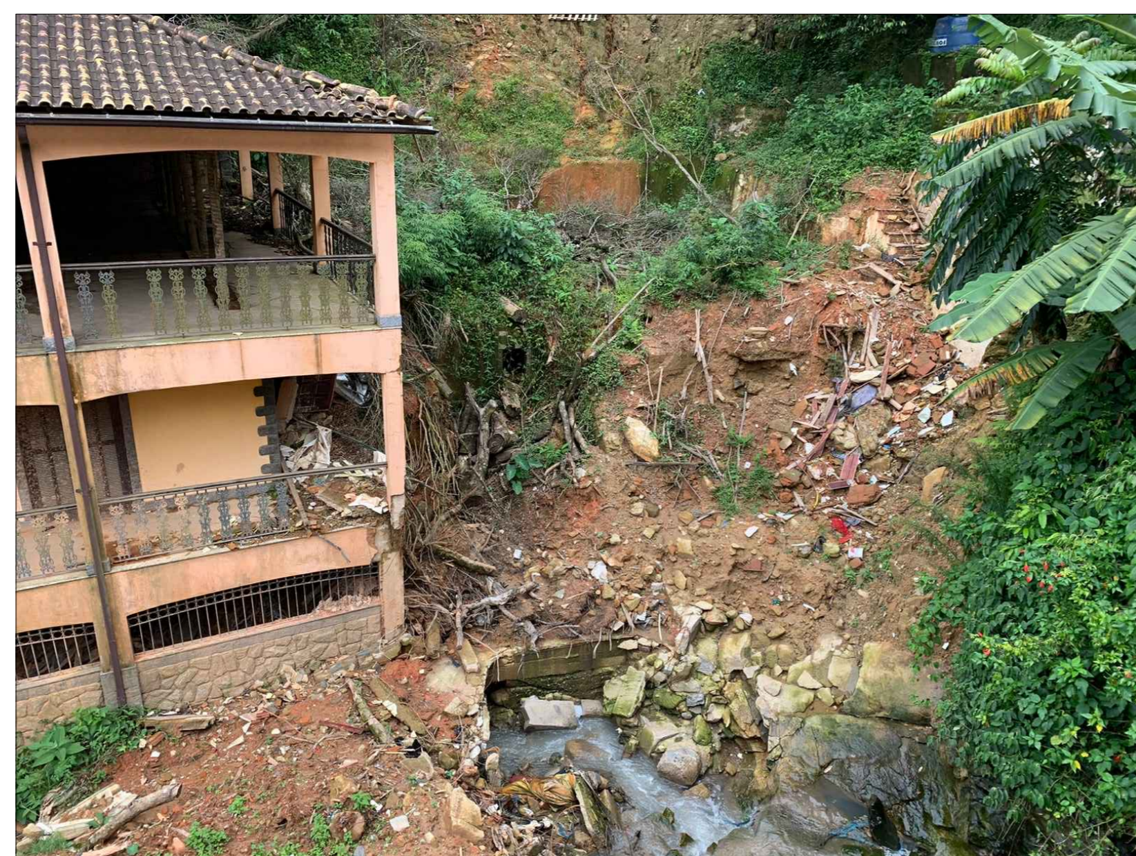
3 TRECHO 01 - LIMPEZA DO CANAL + MURO EM GABIÕES