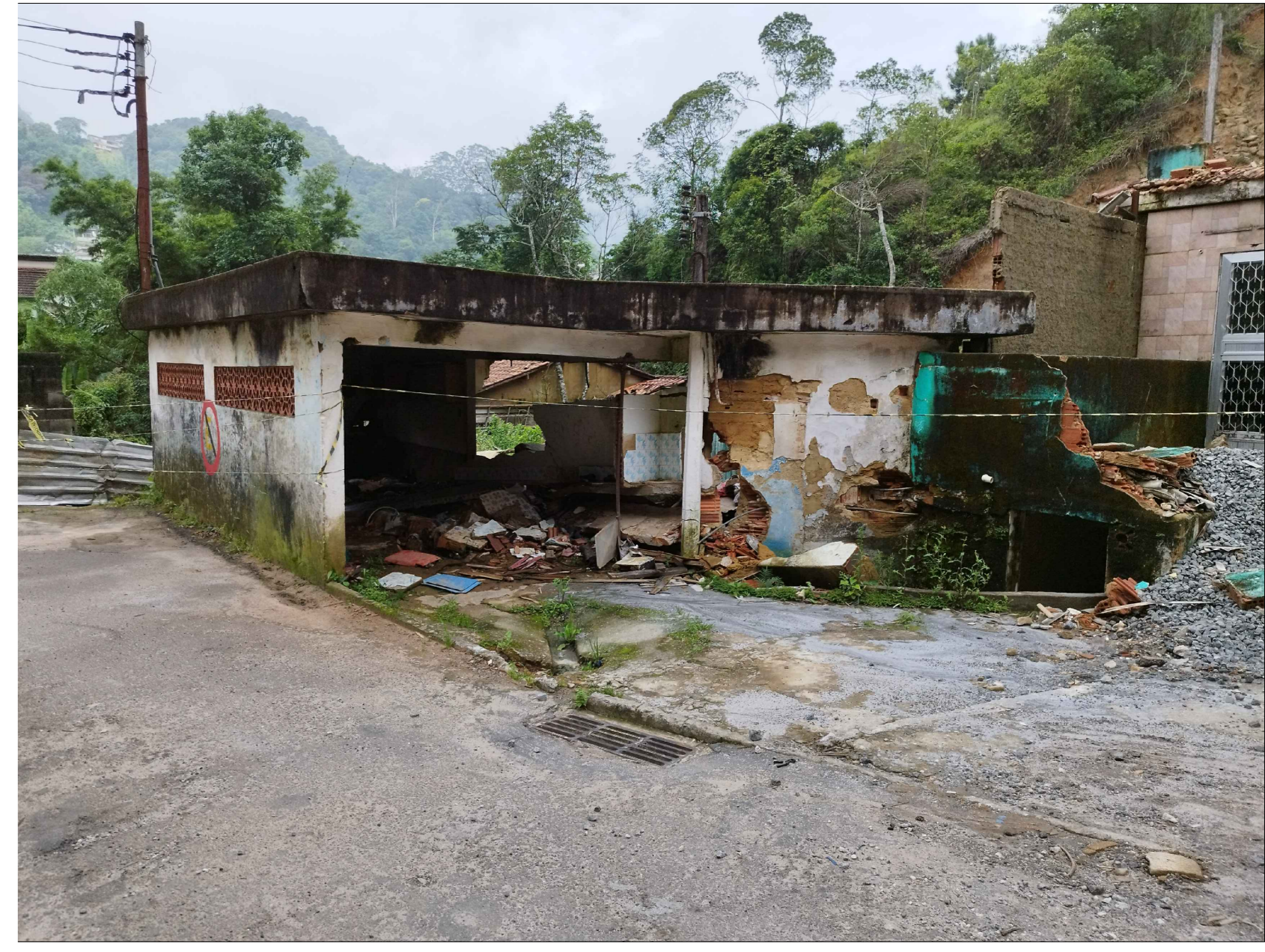
6 TRECHO 03 - DEMOLIÇÃO DE CONSTRUÇÃO EM RUÍNAS