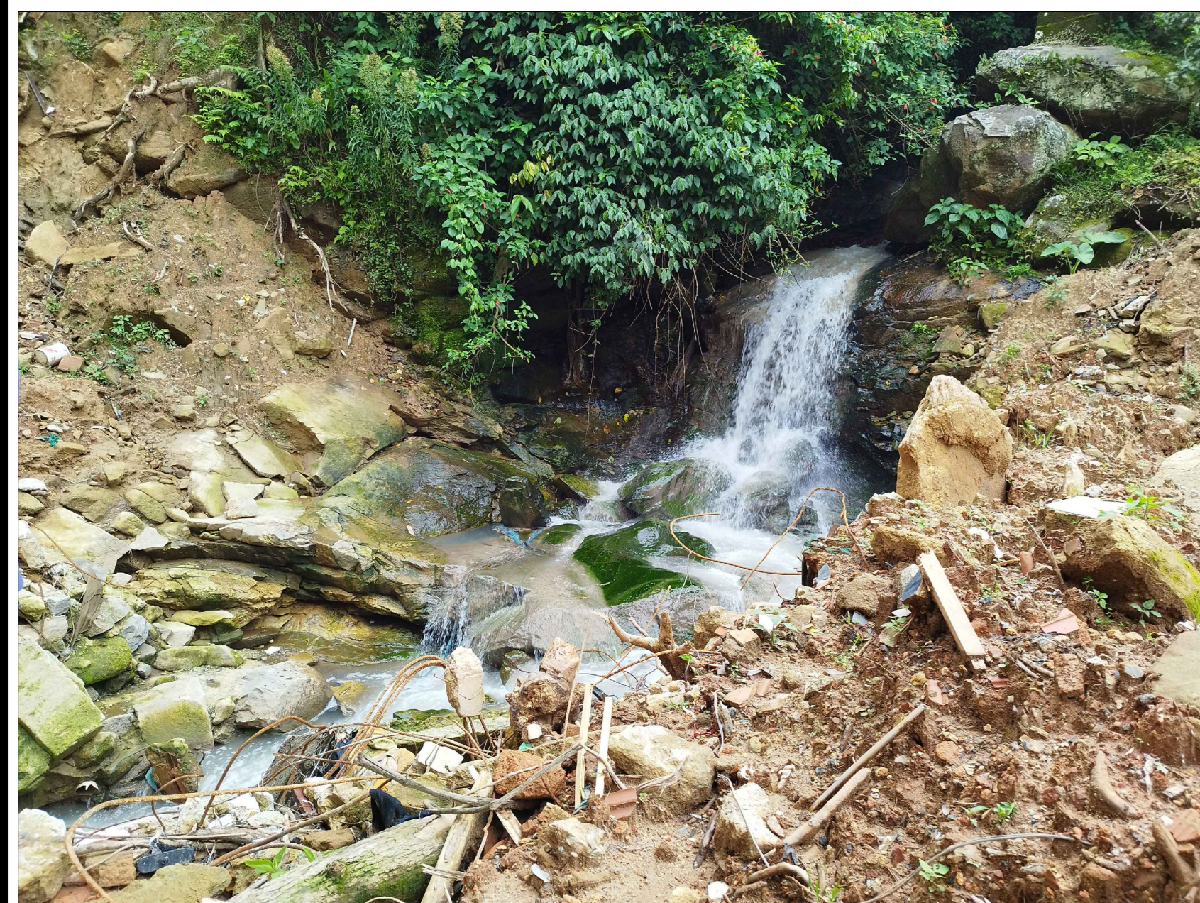
2 TRECHO 01 - LIMPEZA DO CANAL + MURO EM GABIÕES