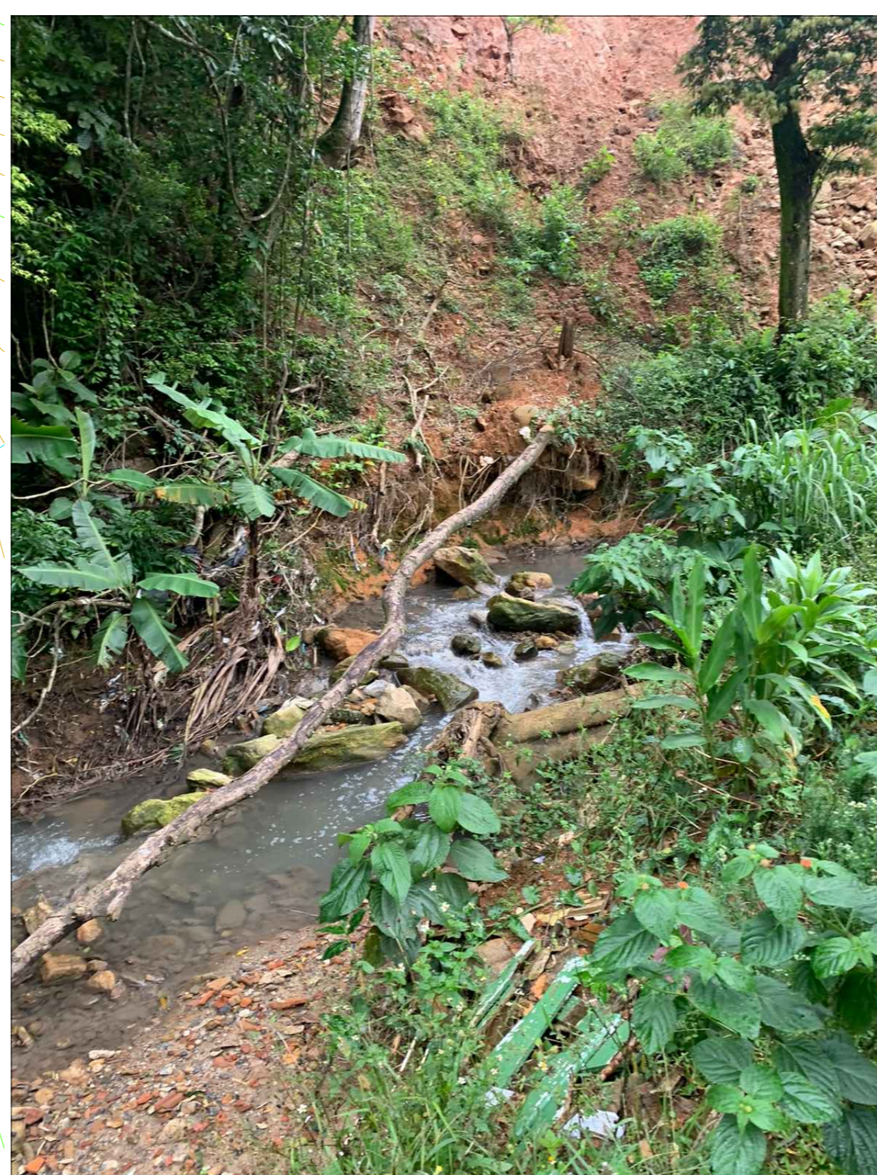
8 TRECHO 05 - LIMPEZA DO CANAL + REMOÇÃO DE BLOCOS DE ROCHA