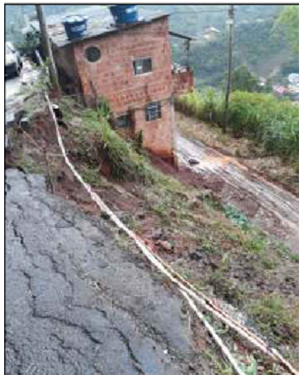
LOCAL DA OBRA