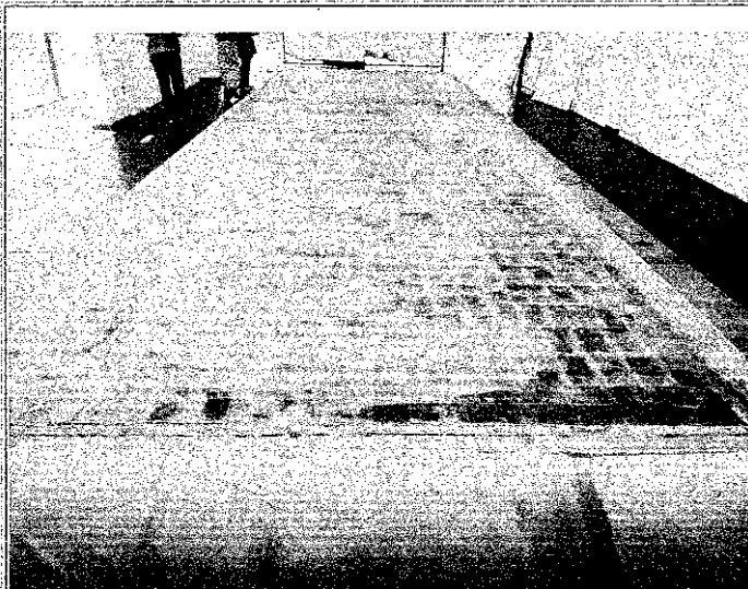
Imagem 1: obra no local, no dia da vistoria.