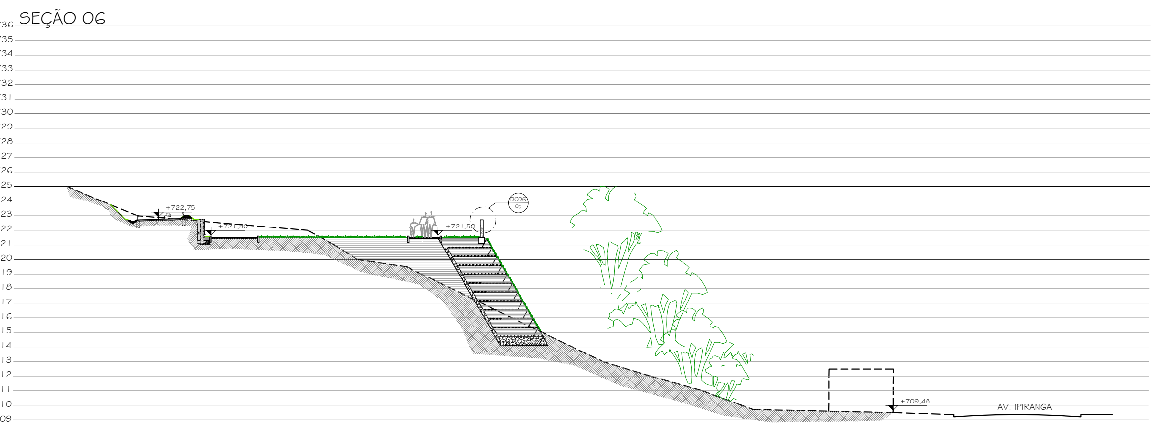
6 SEÇÃO 06 1/200