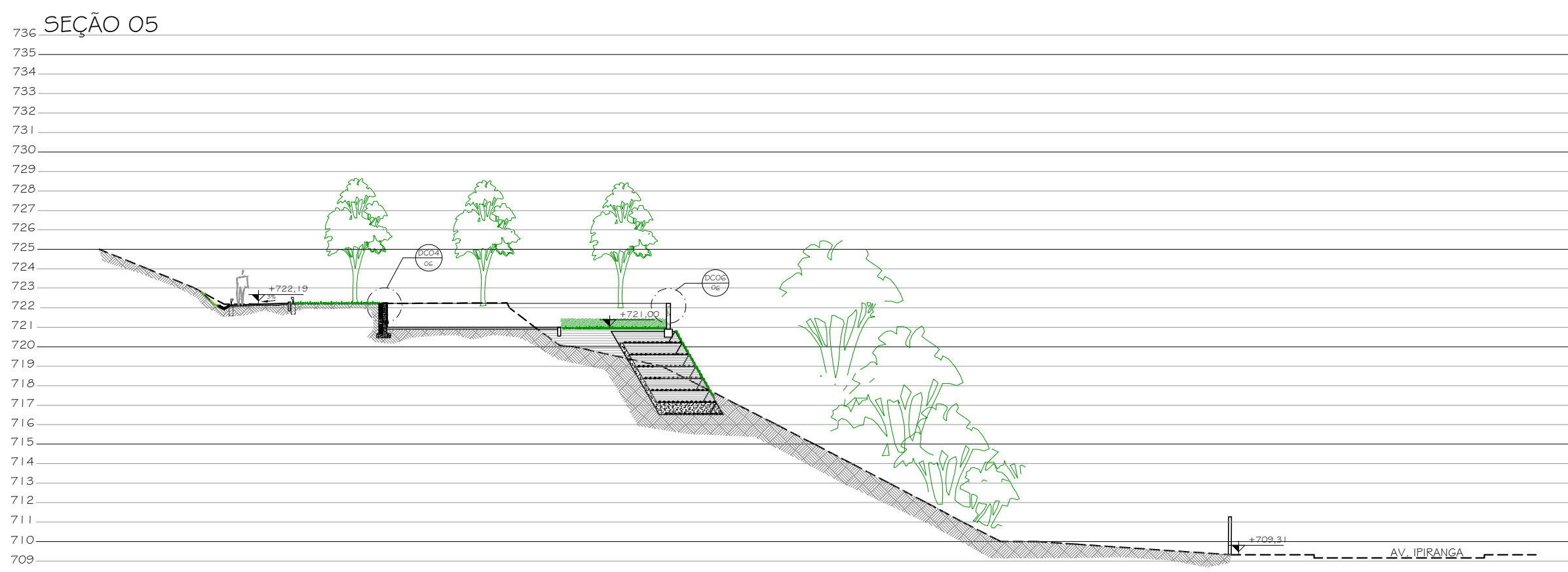
5 SEÇÃO 05 1/200