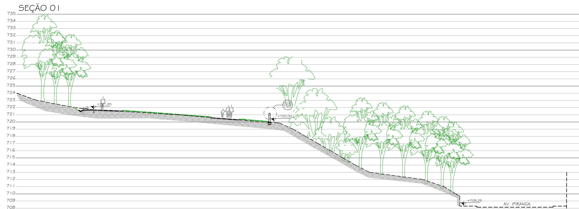
1 SEÇÃO 01 1/200