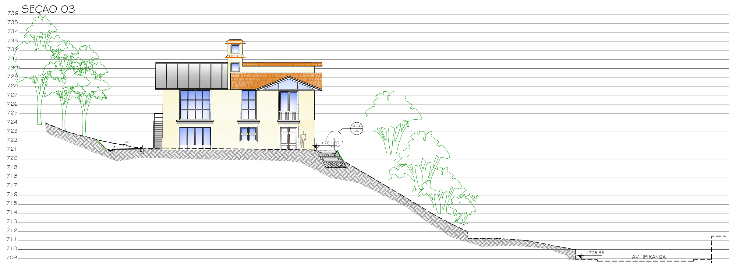
3 SEÇÃO 03 1/200