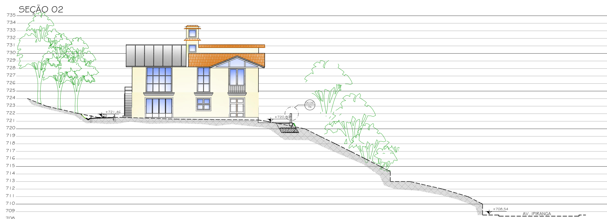
2 SEÇÃO 02 1/200