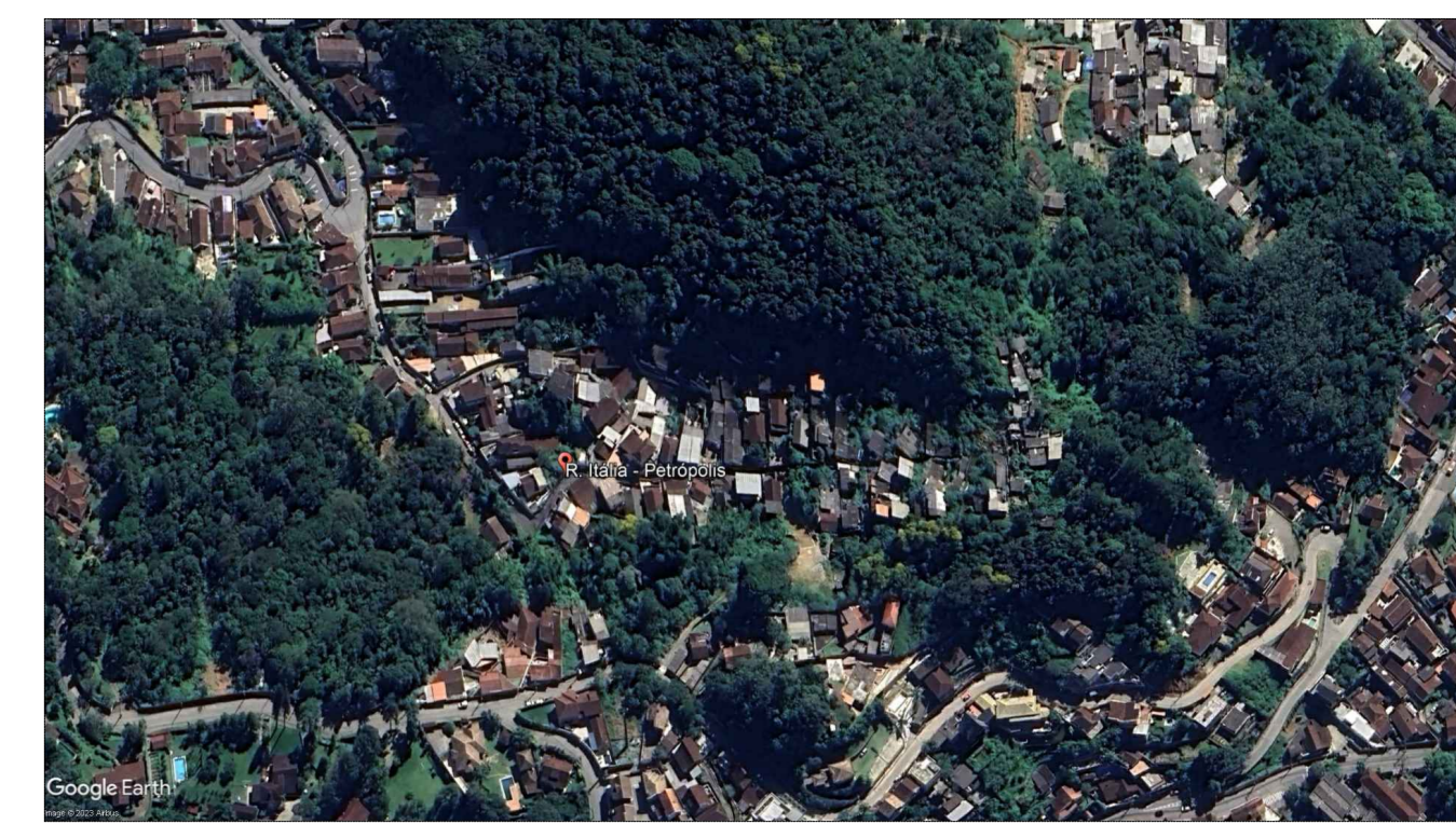
2 LOCALIZAÇÃO SEM ESCALA