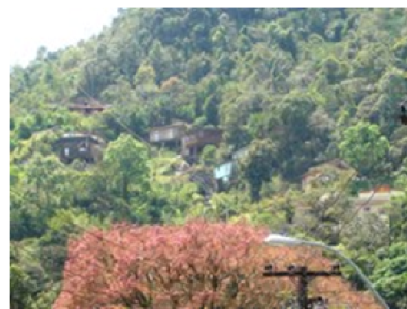
FOTO 79 - Expansão para áreas florestadas