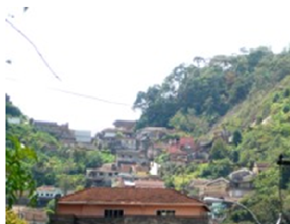
FOTO 78 - Ocupação consolidada