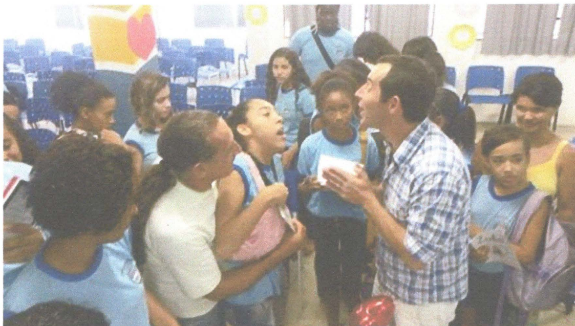
Aluna com paralisia cerebral

Fotos de edições anteriores com a participação de alunos com necessidades especiais.