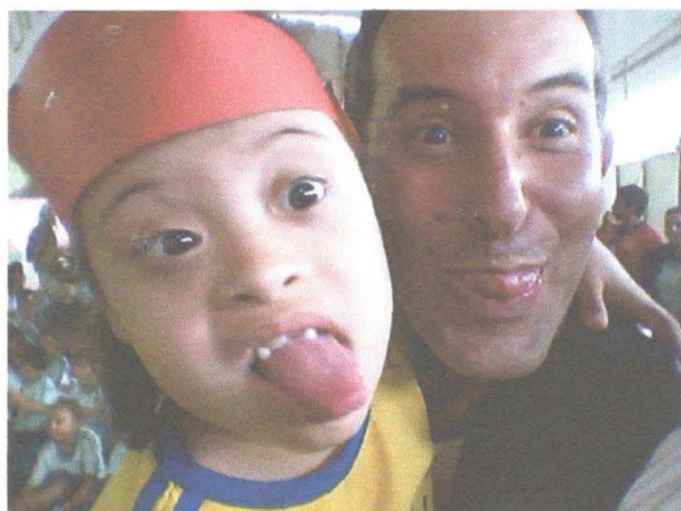
Aluna com síndrome de down