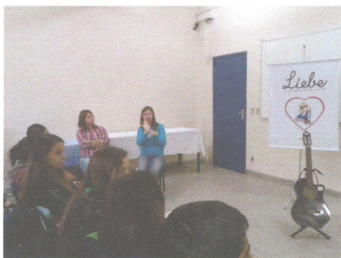
Profissional de libras