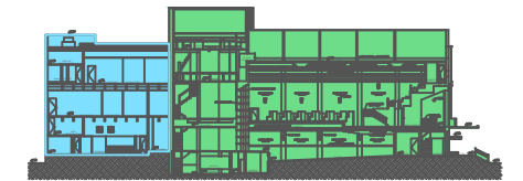
1 CORTE A-1 ESCALA 1:500