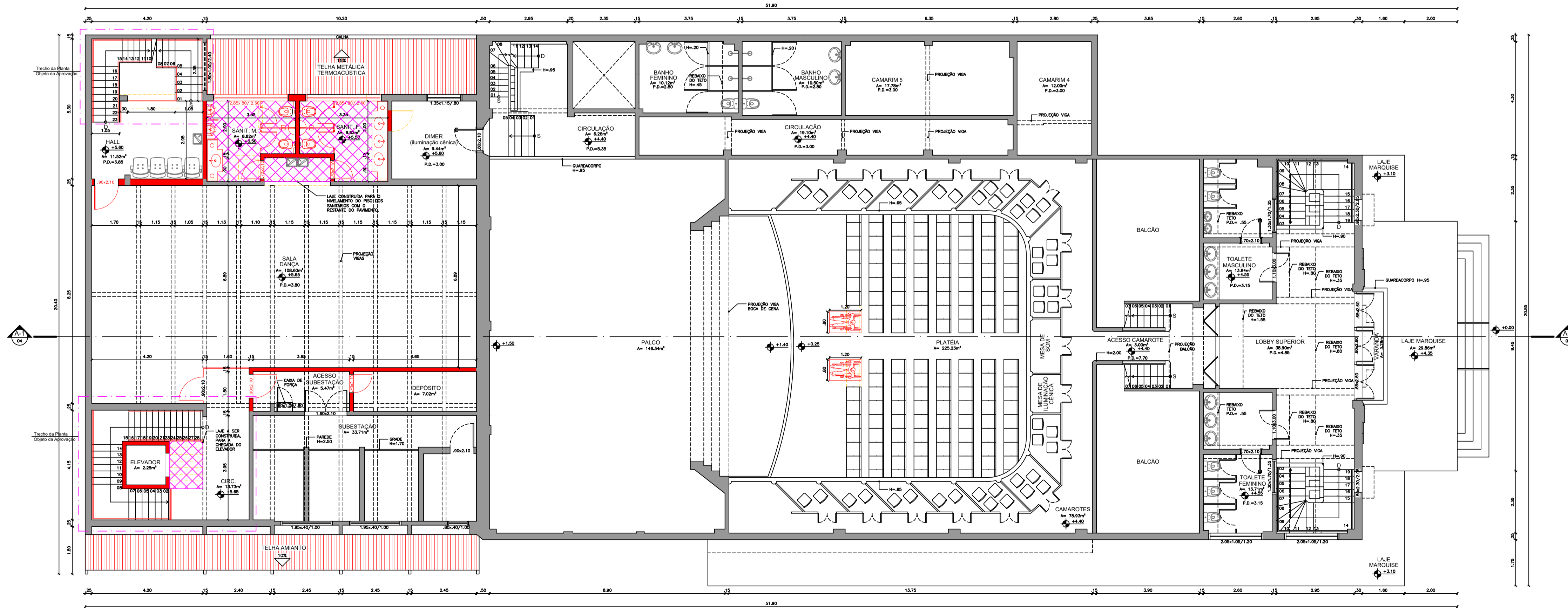
2 PLANTA BAIXA 1º PAVIMENTO