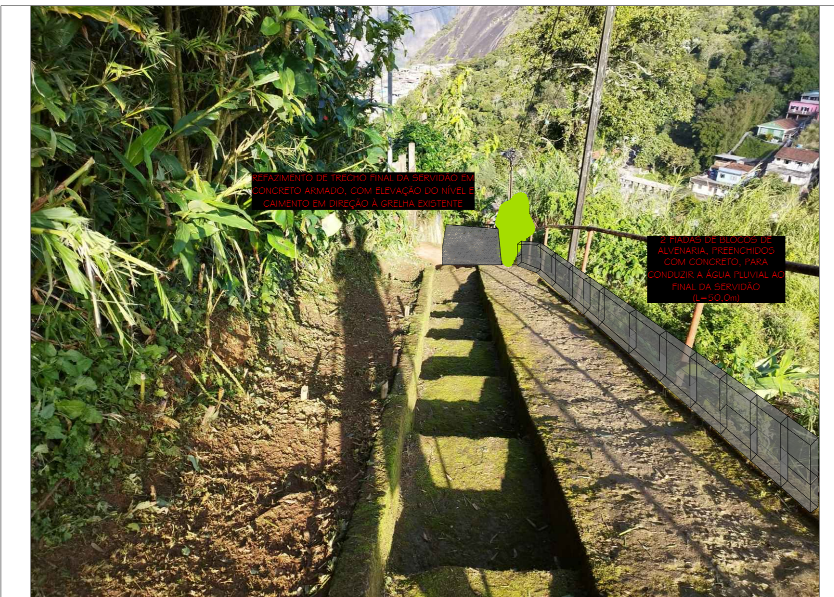
1 FIGURA 01 - INTERVENÇÕES SERVIDÃO SUPERIOR SEM ESCALA