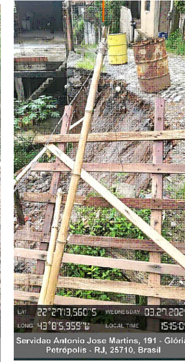
FOTO DO LOCAL DA INTERVENÇÃO

OBS: MEDIDAS EXPRESSAS EM METROS. TODAS AS MEDIDAS DEVEM SER CONFERIDAS NO LOCAL.