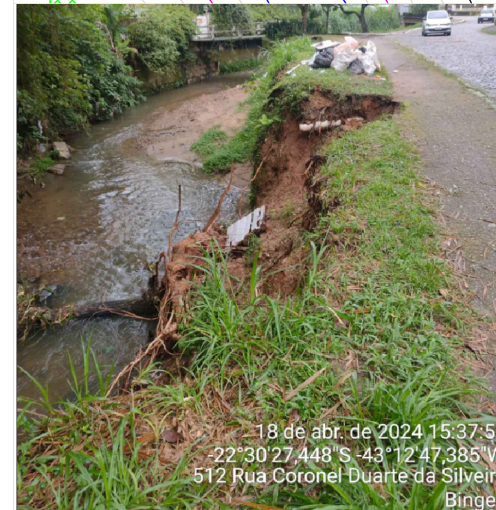
FOTO DO LOCAL DA INTERVENÇÃO

OBS: MEDIDAS EXPRESSAS EM METROS. TODAS AS MEDIDAS DEVEM SER CONFERIDAS NO LOCAL.