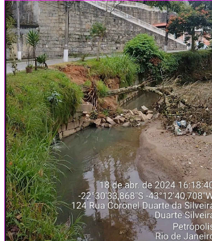
FOTO DO LOCAL DA INTERVENÇÃO

18 de abr. de 2024 16:18:40 -22°30'33,868"S -43°12'40,708"W 124 Rua Coronel Duarte da Silveira Duarte Silveira Petrópolis Rio de Janeiro