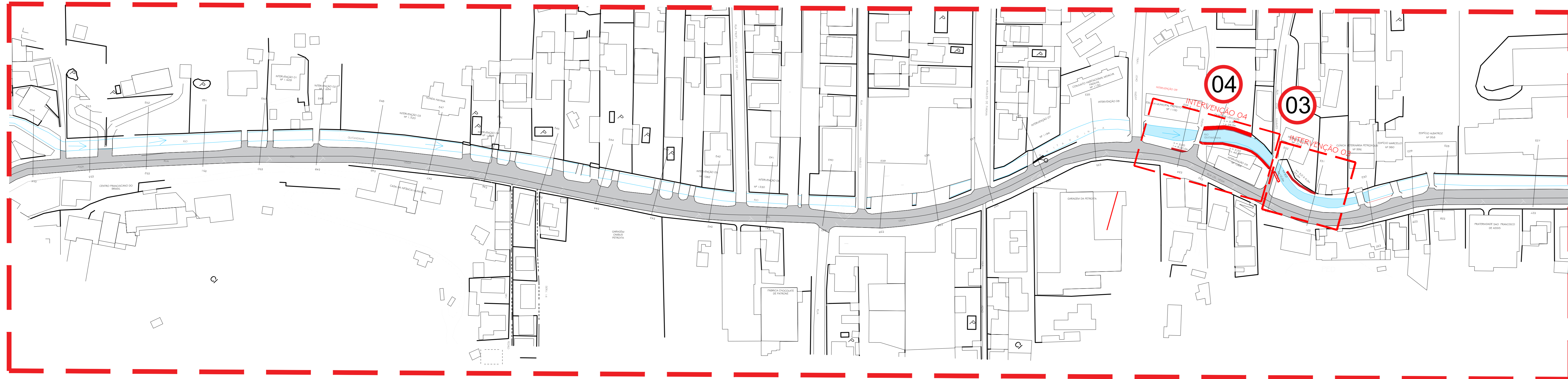
2 ARRANJO GERAL DE INTERVENÇÕES - RUA CEL. VEIGA - TRECHO 02 - E27 A E54