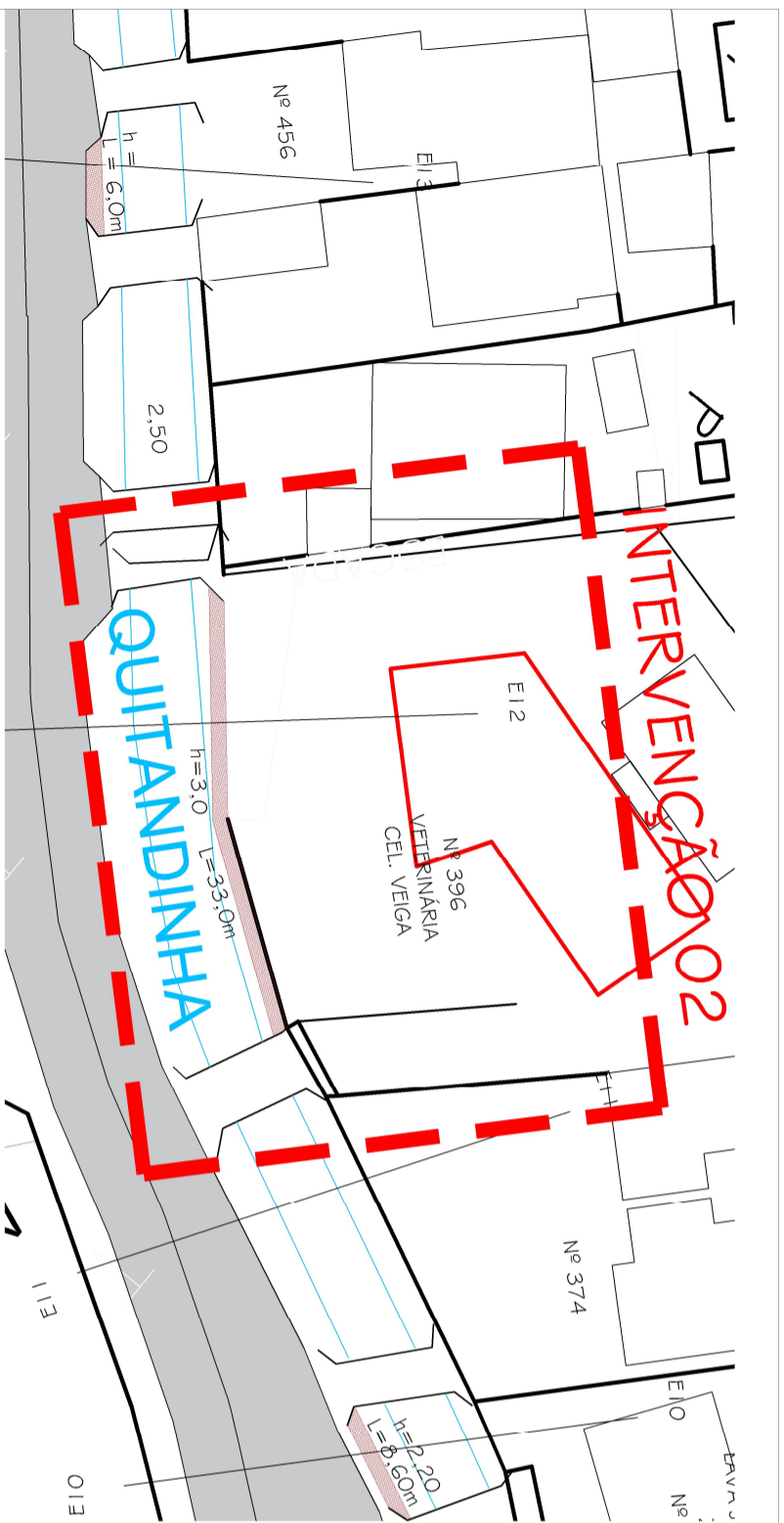
1 LOCALIZAÇÃO 1/500